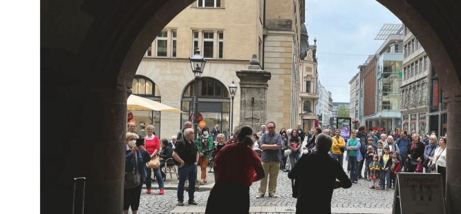
"Le Chaim"/ 3. Jüdisches Straßenmusikfestival