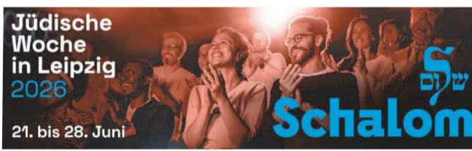
Jüdische Woche in Leipzig 2026 21. bis 28. Juni Schalom