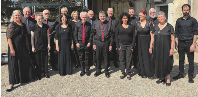
Konzert zum Bachfest "The Madrigal Singers"

Montag, 22. Juni | 15 - 18 Uhr Le Chaim - 3. Jüdisches Straßenmusikfestival In diesem Jahr wird es zum dritten Mal das Jüdische Straßenmusikfestival Le Chaim geben. Auf der Grimmaischen Straße in der Leipziger Innenstadt spielen Musikerinnen und Musiker jüdische Musik in vielen Facetten.